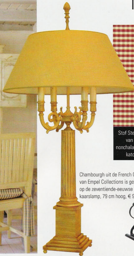
Chambourgh uit de French Classic-serie van Empel Collections is geïnspireerd op de zeventiende-eeuwse Franse kaarslamp, 79 cm hoog, € 970.

Sierpot Deco XXL van PTMD is maar liefst 61 centimeter hoog, € 206.