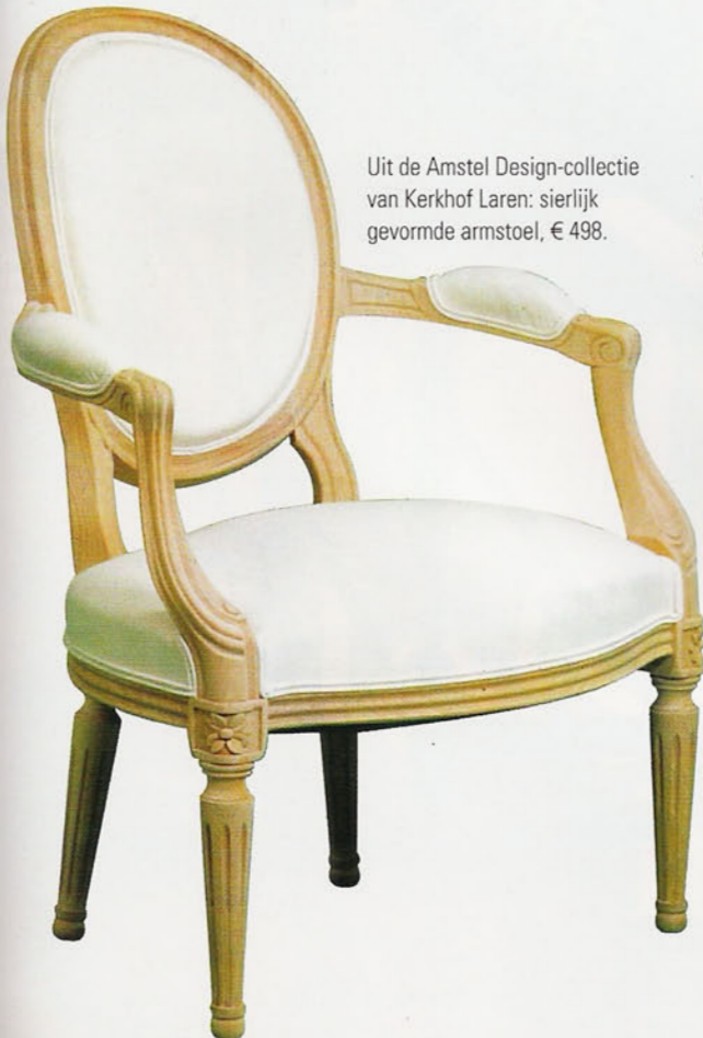
Uit de Amstel Design-collectie van Kerkhof Laren: sierlijk gevormde armstoel, € 498.

Licht, ruimte en zorgvuldig gekozen kleuraccenten vervullen een glansrijke hoofdrol